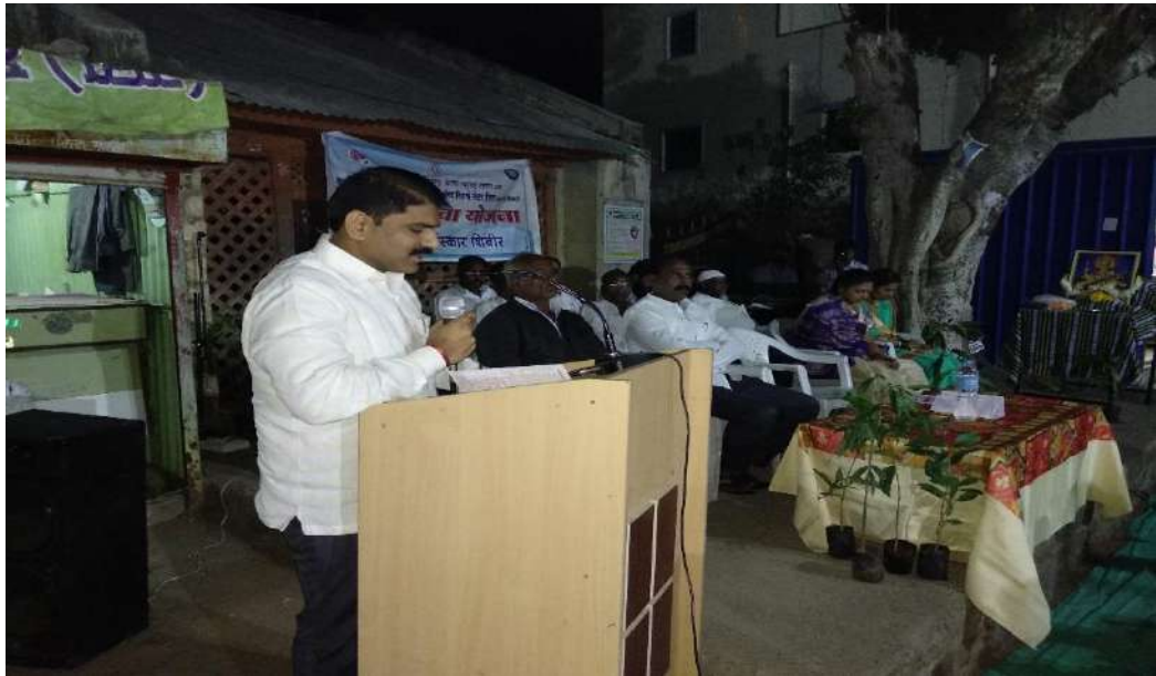
Inauguration of program

A/P;- Khambale (Bha) Near Karve, MIDC Vita Phone & Fax:- (02347) 229021 Email:aitrc_vita@rediffmail.com Web:- www.aitrc.org