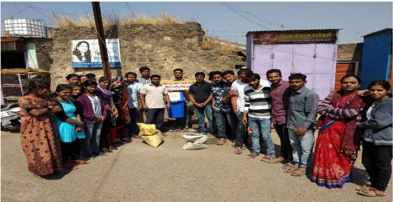
Installation of Dustbin