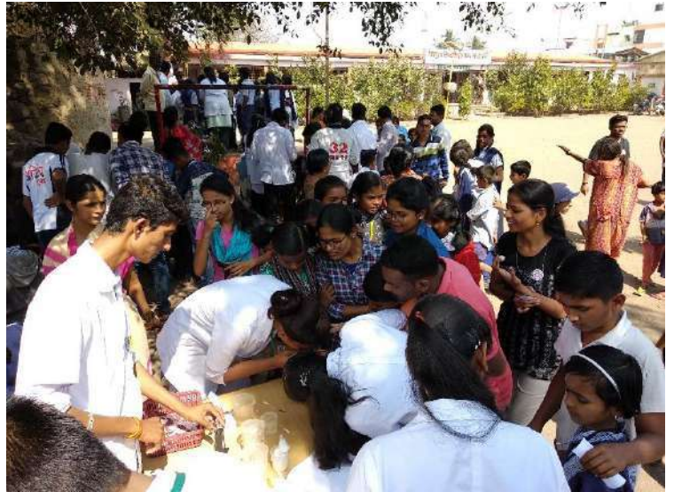
H.B. checking and Blood group checking Camp