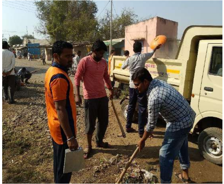
Cleaning of all village