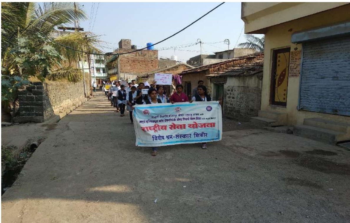
Rally to AIT Student in Bhalavani

A/P;- Khambale (Bha) Near Karve, MIDC Vita Phone & Fax:- (02347) 229021 Email:aitrc_vita@rediffmail.com Web:- www.aitrc.org